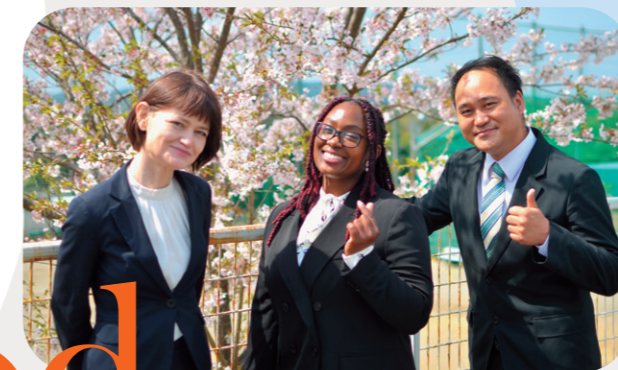
翔凜高等学校 ネイティブの先生方