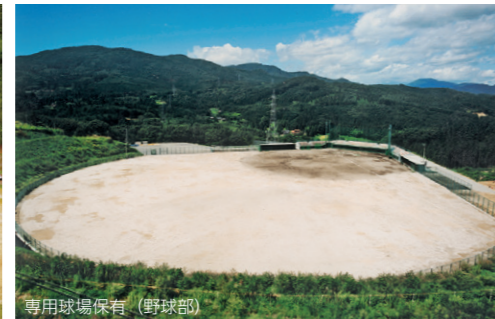
専用球場保有（野球部）